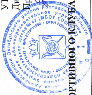
ГРАФИК РАБОТЫ ШКОЛЬНОГО СПОРТИВНОГО КЛУБА